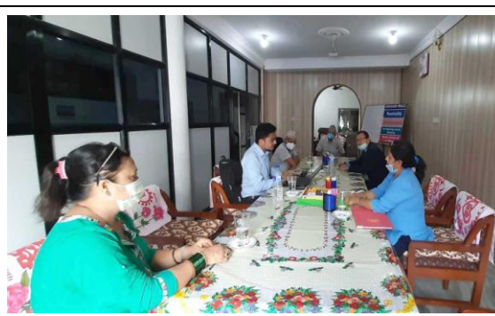
प्रोवेशन कार्यक्रमको छलफल ।