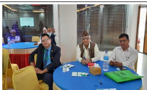
विशिष्टकृत सहकारी संघको कार्यक्रम ।