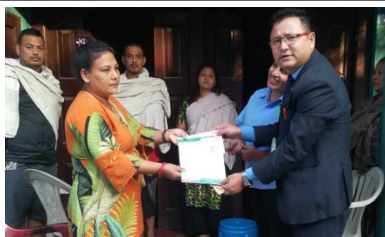
सदस्यलाई राहत प्रदान ।