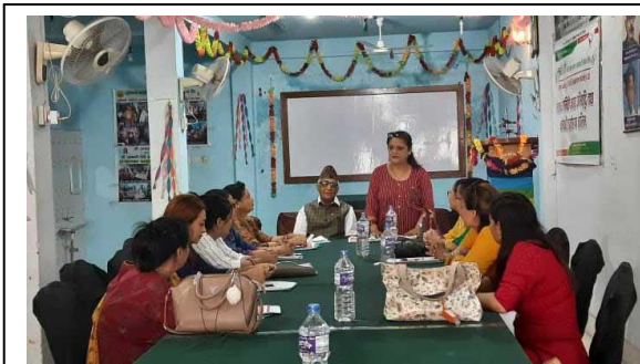
लुम्बिनी साकोसको महिला उप-समितिको बैठक ।