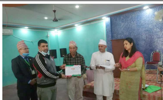
बेलवास सेवा केन्द्रमा सहकारी शिक्षा तालिम प्रशिक्षार्थीलाई प्रमाण पत्र वितरण ।