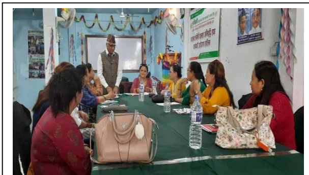
लुम्बिनी साकोसको महिला उप-समितिको बैठक ।