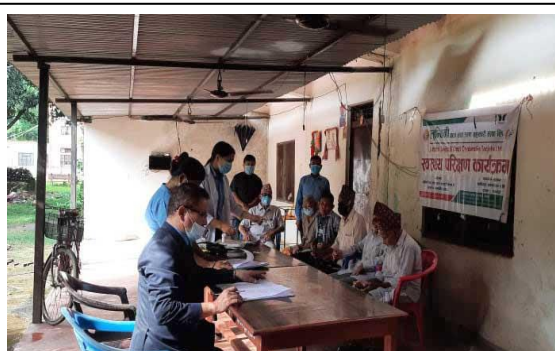
लुम्बिनी साकोसबाट वृद्धा वृद्धाहरुको स्वास्थ्य परिक्षण ।