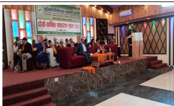
विशेषीकृत सहकारी संघ लि.को दोस्रो वार्षिक साधारण सभा कार्यक्रम ।