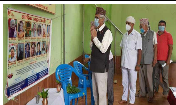
सामुहिक शोक समवेदना कार्यक्रम ।