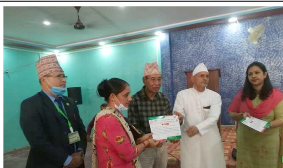
बेलवास सेवा केन्द्रमा सहकारी शिक्षा तालिम प्रशिक्षार्थीलाई प्रमाण पत्र वितरण ।