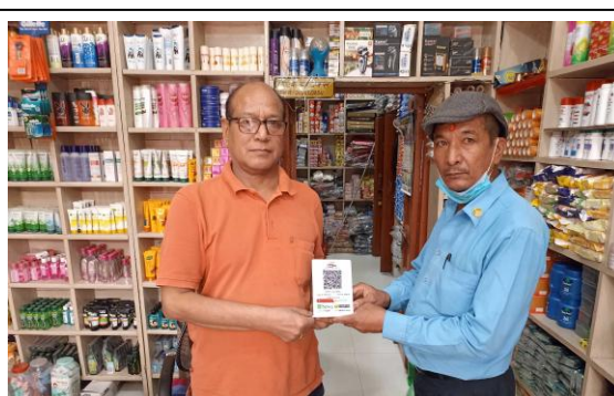
लुम्बिनी साकोसको क्यूआरकोड वितरण ।