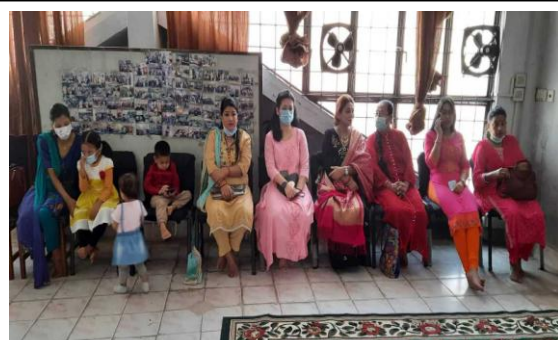
लुम्बिनी साकोसमा २०७८ सालको लक्ष्मी पुजा तथा शुभकामना आदान प्रदान ।