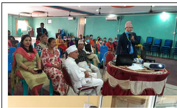
बेलवास सेवा केन्द्रमा सहकारी शिक्षा तालिम ।