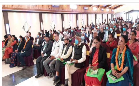
विशेषीकृत सहकारी संघ लि.को दोस्रो वार्षिक साधारण सभा कार्यक्रमको सामुहिक फोटो ।