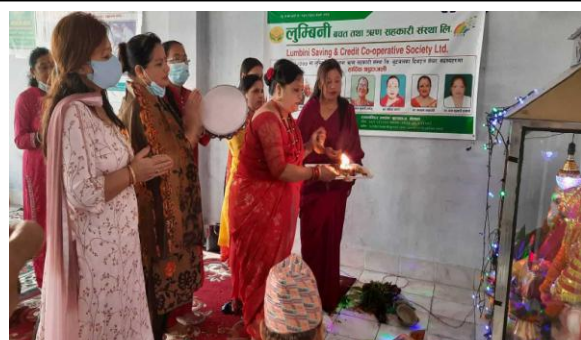
लुम्बिनी साकोसमा २०७८ सालको लक्ष्मी पुजा तथा शुभकामना आदान प्रदान ।