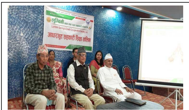
बेलवास सेवा केन्द्रमा सहकारी शिक्षा तालिम ।